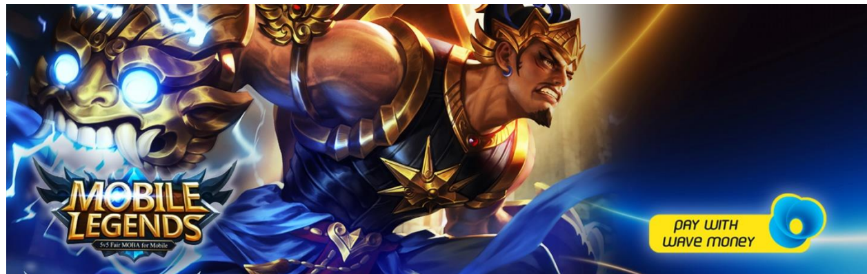
Figure 2. Pay with Wave Money for Mobile Legends Diamonds

Wave Money အသုံးပြုသူများ သည် Ezytics မှ ရုပ်ရှင်လက်မှတ်များကိုလည်းကောင်း၊ Food2U နှင့် အစားအစာမှာယူနိုင်ခြင်းကို လည်းကောင်း၊ White Merak app မှတစ်ဆင့် ဒီဂျစ်တယ် ကာတွန်းစာအုပ်များ စသည်တို့ ကို cashless payments မှတစ်ဆင့် လွယ်ကူချောမွေ့စွာ ဝယ်ယူနေကြပြီဖြစ်ပါသည်။ ပြီးခဲ့သည့် သီတင်းပတ်များတွင်လည်း 'Pay with Wave Money' ကို အသုံးပြုပြီး customers များ က Yoma Yangon International Marathon လက်မှတ်များ ဝယ်ယူခဲ့ကြပါသည်။ လာမည့်လအတွင်း Wave Money ကို အသုံးပြုကာ ကုန်ပစ္စည်းမျိုးစုံနှင့် ဝန်ဆောင်မှုများစွာ ပိုမိုဝယ်ယူနိုင်တော့မည်ဖြစ်သည်။